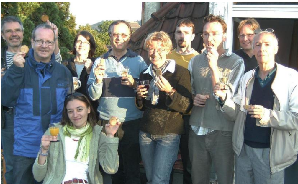
Anstoßen der IFIS-Gründungsmitglieder bei der Gründungsklausur am 20.9.2008

Der Verein wurde am 20. September 2008 von 11 Mitgliedern gegründet und am 25. November 2008 ins Vereinsregister eingetragen.